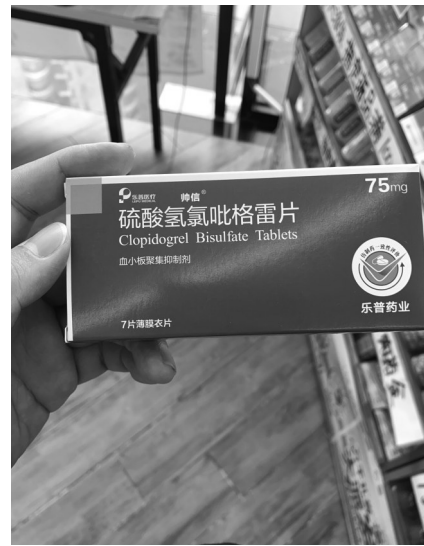
同品牌同规格药品,不同药店售价相差近1倍