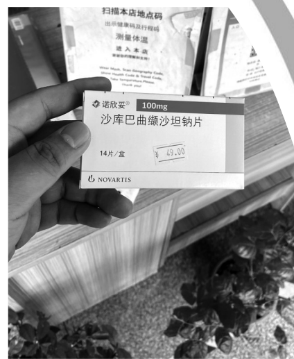
店内定价49元的沙库巴曲缬沙坦钠片,线上卖68元

对于医院和网上商店的同厂家、规格的药品售价差距较大的问题,记者了解到,目前海口市公立医院按照集采价实行零加成销售,即按照进货价进行销售;网上商店属于市场调节价,只要是明码标价即可。由于药品生产厂家对于各省市医疗机构和药店的药品出厂售价有高低,由所在地招标和市场大小、进货渠道等多种因素决定。因此,药品售价有所差别,消费者可根据自身需求自主选择购买药品。