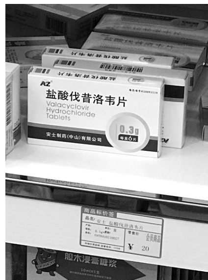
同品牌同规格盐酸伐昔洛韦片,最低20元,最高40元