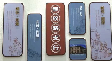
网点墙壁装饰精美