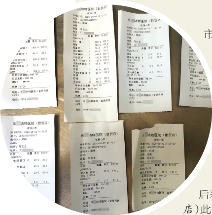
▲黑咪的就诊收费单