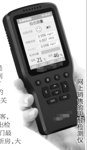
网上销售的甲醛检测仪

昨日,记者采访了十多位租客,大多数人称,租房时并未特别提出检测甲醛,而合同、环境等才是他们最关心的问题,“租房市场很少有新房,大多是老房子,没必要检测甲醛。”