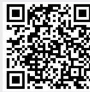
“椰城交警”新浪微博二维码