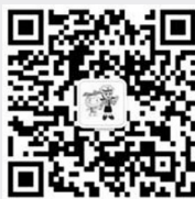
“椰城交警”微信二维码

扫码添加椰城交警微信公众号、海口公安交警客户端和新浪微博二维码,既可了解海口公安交警最新资讯动态,还可享受更多便民服务。