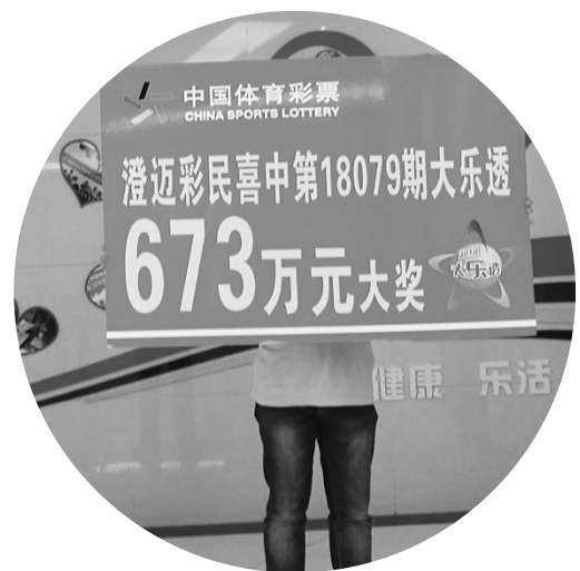
本版稿件均由记者 钟起的 文/图

对于这笔奖金怎么花,陈先生表示,他和妻子首先想到的是去旅游,“平时一直为儿女操劳,妻子还要带孙子。大家平时都很辛苦,所以希望全家人一起出去旅游。”