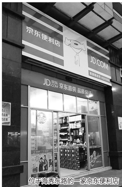
位于海秀东路的一家京东便利店

本报讯 自马云、刘强东去年相继提出“新零售”和“无界零售”以来,阿里巴巴和京东齐齐开始布局线下零售店。记者近日在街头发现,几家京东便利店已悄然营业,开始在海口试水。