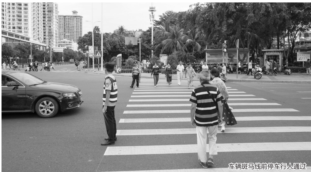
车辆斑马线前停车行人通过