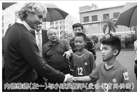
内德维德(左一)与小球员握手