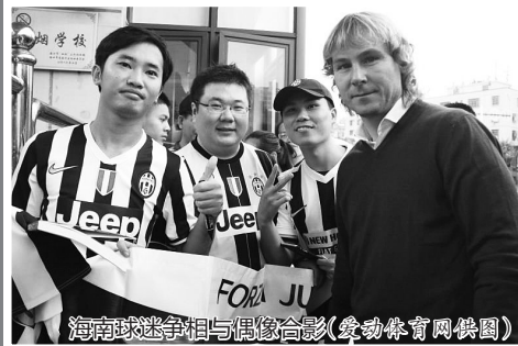
海南球迷争相与偶像合影