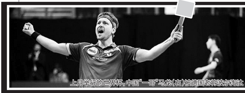
上月举行的世界杯,中国“一哥”马龙(右)被德国老将波尔淘汰