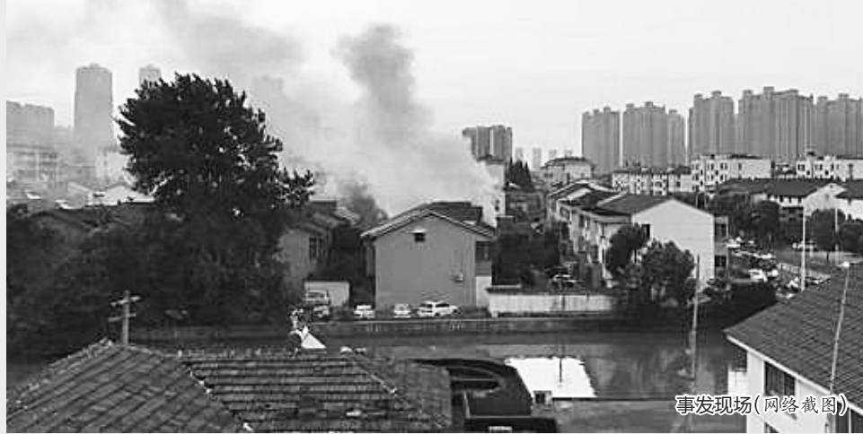
事发现场(网络截图)

常熟漕泾新村2区的多位居民告诉记者,起火民房里居住的多为二三十岁的年轻人,平时大家交集比较少,只是知道这栋房子里的人一般都在晚上10点钟左右回来,“声音会比较吵闹”。综合新京报、新华社等报道